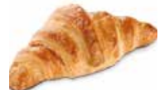
CROISSANT GRANDE RECTO CÓDIGO: 0206 PESO g: 90 CAJA: 64 unids