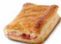
RECTÁNGULO DE JAMÓN YORK Y QUESO CÓDIGO: 0712 PESO g: 125 CAJA: 30 unids