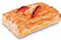
PANAL DE CREMA CÓDIGO: 0713 PESO g: 145 CAJA: 40 unids