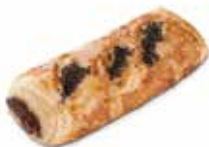
CAÑA DE CHOCOLATE CÓDIGO: 0703 PESO g: 160 CAJA: 40 unids