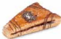
TRIÁNGULO DE CHOCOLATE CÓDIGO: 0219 PESO g: 150 CAJA: 48 unids