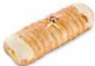
CAÑA DE CREMA CÓDIGO: 0702 PESO g: 160 CAJA: 40 unids