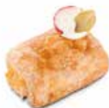
CHIPS DE SALMÓN CÓDIGO: 0607 PESO g: 20 CAJA: 3 Kg