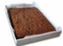
PLANCHA DE CHOCOLATE CON CHIPS 37x28 CÓDIGO: 1517 PESO g: 2X1800 CAJA: 2 unids