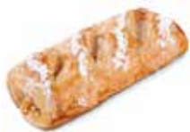
CAÑA DE CABELLO CÓDIGO: 0701 PESO g: 160 CAJA: 40 unids