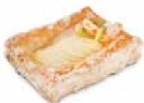
PASTEL DE MANZANA CÓDIGO: 0708 PESO g: 170 CAJA: 30 unids