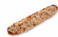
PAN PIZZA DE ATÚN CÓDIGO: 1112 PESO g: 145 CAJA: 22 unids