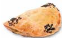
EMPANADILLA GRANDE ARTESANA DE ESPINACAS CÓDIGO: 0835 PESO g: 130 CAJA: 40 unids

Pastelería Amparin Al servicio del profesional