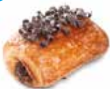
NAPOLITANA DE CHOCOLATE CÓDIGO: 0320 - 0344 PESO g: 125 - 110 CAJA: 30 - 28 unids