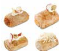
CHIPS SALADOS SURTIDO 4 SABORES Jamón york y queso, sobrasada, atún y salmón. CÓDIGO: 0610 PESO g: 20 CAJA: 6 Kg