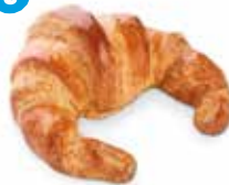
CROISSANT GRANDE CÓDIGO: 0220 PESO g: 110 CAJA: 25 unids