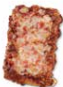
PORCIÓN PIZZA BARBACOA CÓDIGO: 1104 PESO g: 200 CAJA: 30 unids