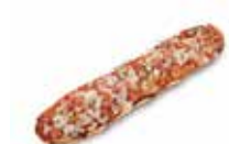
PAN PIZZA DE YORK Y QUESO CÓDIGO: 1110 PESO g: 145 CAJA: 22 unids