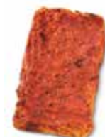
BANDAS DE MASA DE PIZZA Y TOMATE 34x11 CÓDIGO: 1103 PESO g: 280 CAJA: 30 unids