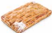
PANAL DE CABELLO CÓDIGO: 0711 PESO g: 145 CAJA: 40 unids