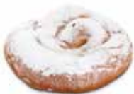
ENSAIMADA CÓDIGO: 0133 PESO g: 60 CAJA: 40 unids