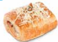
NAPOLITANA DE JAMÓN YORK Y QUESO CÓDIGO: 0305 -0345 PESO g: 145 - 110 CAJA: 30 - 28 unids