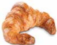
CROISSANT GRANDE ARTESANO CÓDIGO: 0207 - 0210 PESO g: 90 - 125 CAJA: 60 - 48 unids