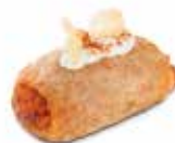
CHIPS DE SOBRASADA CÓDIGO: 0604 PESO g: 20 CAJA: 3 Kg